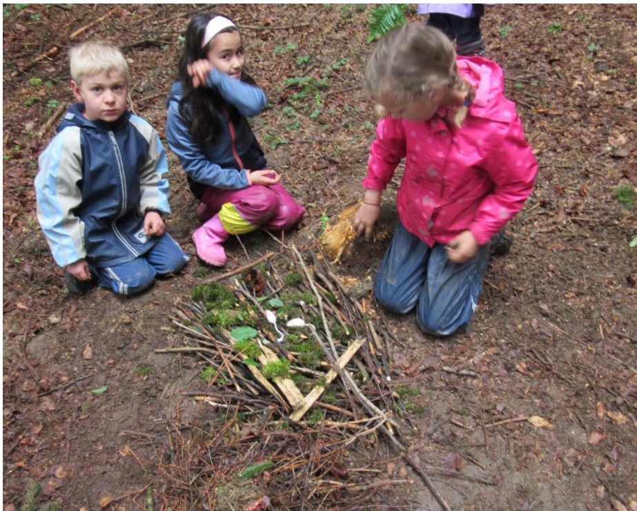
„...weisch, vorher hend mir zwei üs blöd gfunde aber jetzt sind mir Fründinne worde.“