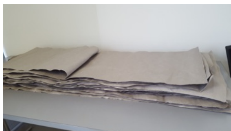
Noch unbearbeitete SnapPap-Bogen

Am Gründonnerstag erhielten wir einen Einblick ins Fach "Textiles Werken". Unter fachkundiger Führung bearbeiteten wir ein neuartiges Material namens "SnapPap", ein veganes Leder, welches wir bemalten, bedruckten und anschliessend zu Beuteln zusammennähten. Der Fantasie waren keine Grenzen gesetzt... und so entstanden bald schon vom kleinen Kartoffelkorbchen über den Blumentopfsack bis hin zum grossen Altpapiersammelsack alle möglichen Kreationen.