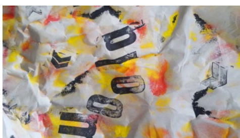
... und mit Stempeln bedruckt