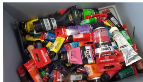
Mit Acrylfarbe wurden die Bogen bemalt...