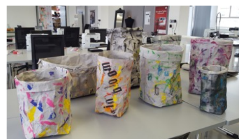
Die fertigen SnapPap-Beutel