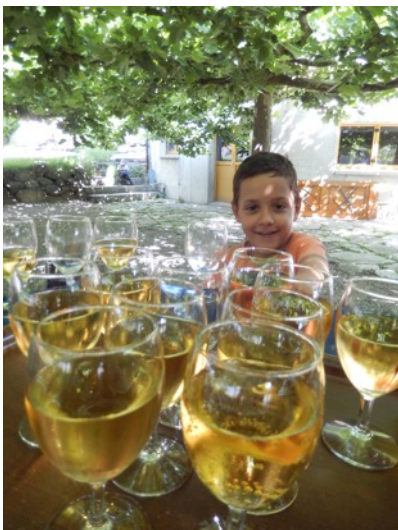
Hier gab's eine Erfrischung...