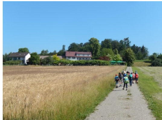
... erreichten wir das Restaurant "Stelzenhof".