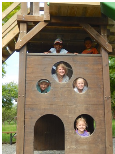
... und Zeit zum Spielen.