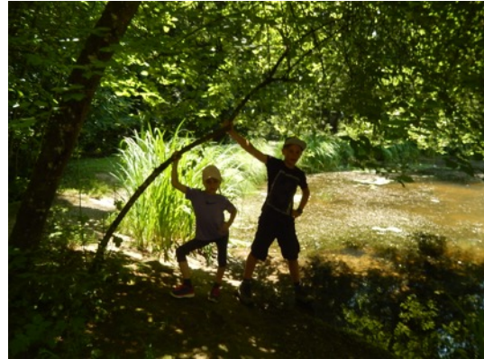
... bis zum "Tätsch".