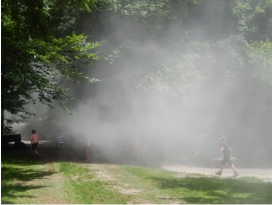
Ein Forstarbeiter wirbelte mit seinem Laubbläser eine Menge Staub auf...