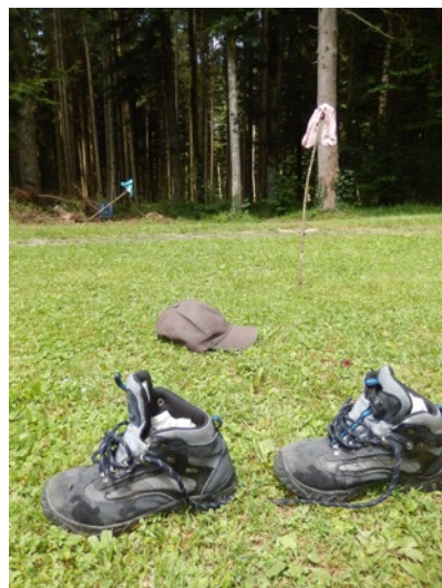
Platsch! Aber zum Glück war das Wetter warm und die Kleider rasch wieder trocken.