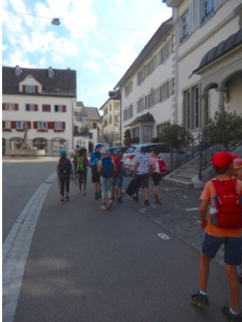
Zuerst ging's quer durch Weinfelden...

Am Donnerstag, 21.6.18, machte sich die 1./3. Klasse bei schönstem Sommerwetter auf zur Schulreise zum Weiher "Tätsch" oberhalb von Weinfelden.