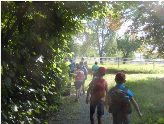
Nach einer abwechslungsreichen Wanderung entlang schattiger Tobel und leuchtender Felder...