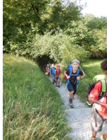
... und dann steil bergauf.