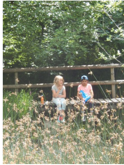
... aber kurz darauf hatten wir es wieder gemütlich.