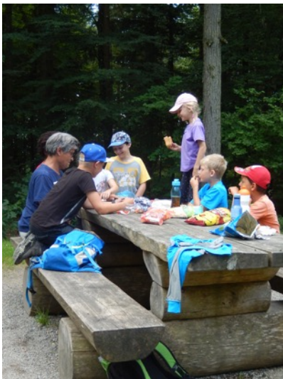
Hier assen wir zu Mittag...