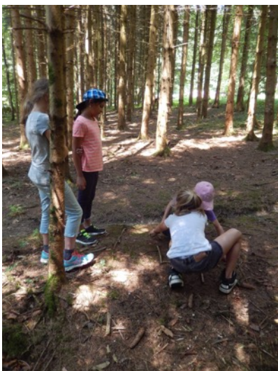
... und erkundeten den Wald.