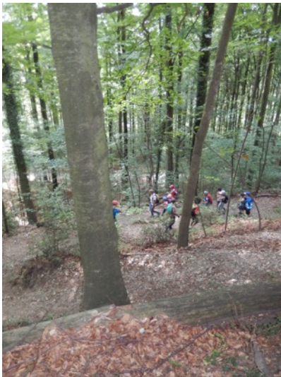
Bald schon war es Zeit, wieder aufzubrechen. Über schmale Waldwege...