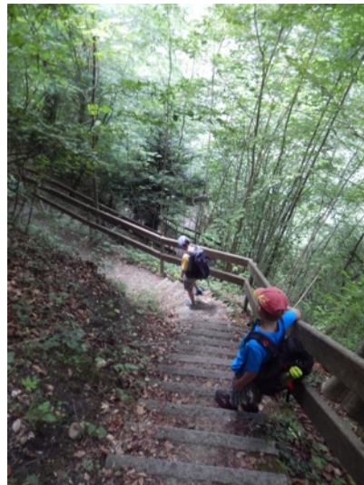
... und steile Treppen kehrten wir nach Weinfeldern zurück und von dort per Zug nach Hause nach Rickenbach.