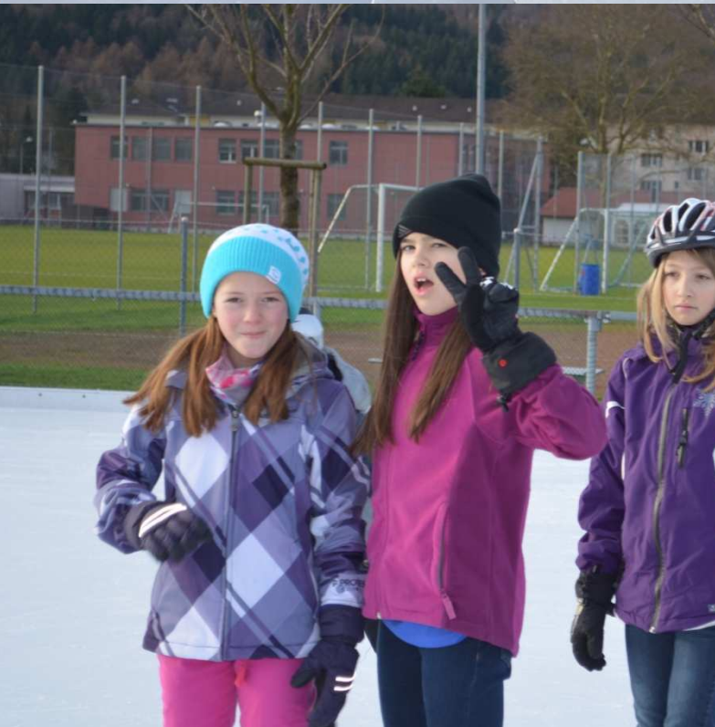
erstellt von 1. und 5. Klasse